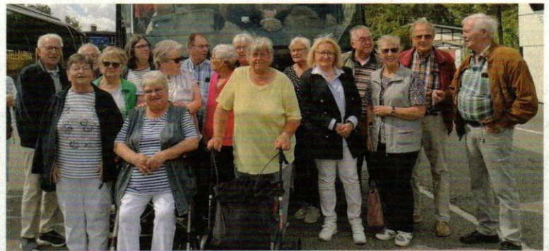
Die Fahrtteilnehmer der Guttempler-Gemeinschaft "Langen".

Nach einem reichhaltigen Mittagessen ging es weiter zur Wakenitzfahrt, welche uns zur ehemaligen Zollstation Rothenhusen führte. In diesem einzigartigen Naturschutzgebiet, das durch den ehemaligen Grenzverlauf fast 40 Jahre unberührt blieb, erlebten wir eine schöne Fahrt durch eine Naturlandschaft mit alten Erlbruchwäldern. Eine Vielfalt an Pflanzen wie See- und Teichrosen, selten gewordenen Vogelarten wie Grau- und Fischreiher sowie große Schwanenkolonien, gab es zu bestaunen.